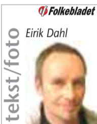
tekst/foto Eirik Dahl